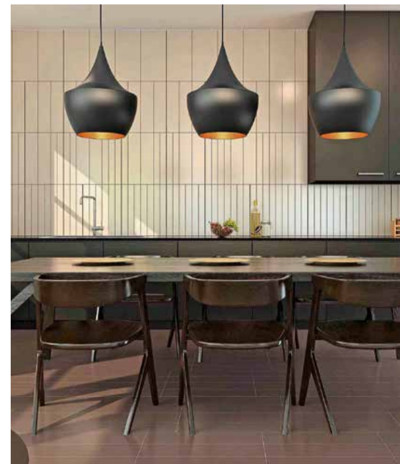
‘Ceramica Vogue’ u Bologni je prikazala novu kolekciju ‘Shade’

Maštovito ukrašavanje pločicama dobar je način da svoj dom učinite uzbudljivim i iznenađujućim te sami preuzmete odvažnu dekoratersku ulogu postizanjem efektnih rješenja koja će vam jamčiti dinamiku i jednostavno uređenje svih životnih prostora ostavljajući estetski dojam kojem će teško itko moći odoljeti.