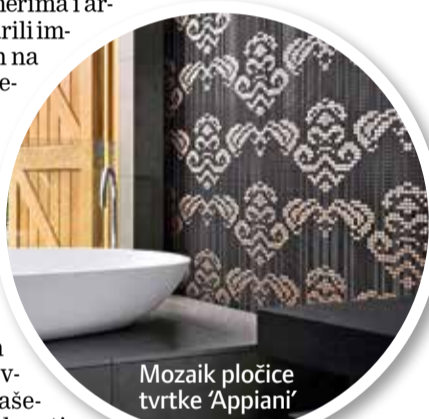
Mozaik pločice tvrtke ‘Appiani’

Ručno ukrašavanje, različite tehnike dekoriranja, modularni formati, mozaični sustavi... novosti su koje će sljedećih godinu dana biti hit kod oblaganja zidova i podova keramičkim oblogama