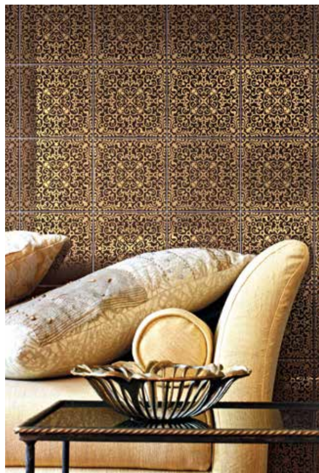
Za ‘Ceramicu Bardelli’ slavni dizajner Marcel Wanders kreirao je pločice ‘Carmen’ ukrašene serigrafijom od čistog zlata

“Ceramica Vogue” zasluženo je stekla reputaciju jednog od vodećih proizvođača glaziranih porculanskih obloga za podove i zidove što potvrđuje i podatak da trenutno na godišnjoj razini proizvedu 2.500.000 četvornih metara pločica. Odlična upotpunjenost kompletne linije proizvoda i savršena međusobna koordinacija serija čine sve vrste njihovih proizvoda međunarodno priznatima i vrlo traženima na svjetskom tržištu. Pločice su dostupne u 181 boji i ističu se različitim tehničkim značajkama, a uz ponudu 46 modularnih formata kombiniranjem različitih veličina identičnim mo-