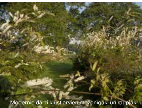
Modernie dārzi kļūst arvien mežonīgāki un raupjāki.

dos pie saviem pirmajiem klientiem, galdi viņu mājās vai lūza no dārzu žurnālu smaguma, kas tur gulēja simtiem. Un man tika rādītas cita par citu krāšņākas idejas – tās visas cilvēki vēlējās īstenot savos dārzos. Žurnālus uztver kā augu katalogus. Ir jāaizmirst, ka visu, kas tajos redzams, varētu atkārtot piemājas platībā! Katram dārzam ir savs raksturs, savs augsnes sastāvs, katrs no tiem ir pakļauts citādiem klimata apstākļiem. Un vēl kāds sākums – ir jāatceras par dārza kopšanu. Var gadīties, ka tas būs katru dienu jālaista, augi regulāri jācērp un jāgriež. Šie it kā sākumi, par kuriem ir piemirsts, var radīt daudz problēmu. Ir jāizpēta katra situācijas detaļa. Dārza ierīkošana ir sarežģīts un parasti nebeidzams process. Ar izteiksmīgu dārzu var novērst uzmanību no ne sevišķi glītas dzīvojamās mājas. Var arī gluži otrādi – lakonisku dārza iekārtojumu var izmantot par fonu kvalitātei vai nama arhitektūrai.