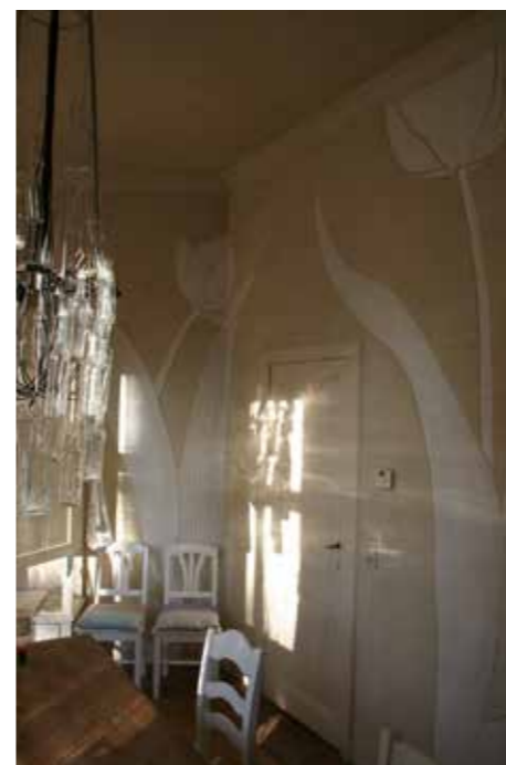
Interjeros Ronalds dažkārt attēlo vienīgi tulpju ziedu fragmentus, uzskatot, ka trūkstošo skatītājs var piedomāt pats.