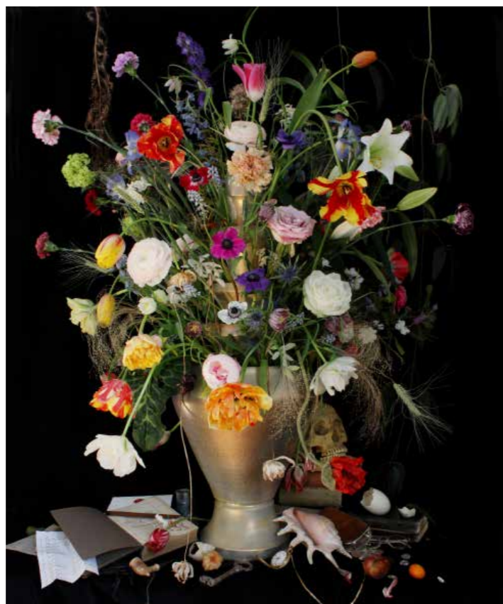
Mūsdienīga van der Hilsta interpretācija par flāmu gleznotāju iemīļoto kluso dabu ar ziediem.

Jā, katru rudeni aicinu cilvēkus uz savu studiju. Tur pārdodu glīti iesaiņotus īpašu tulpju šķirņu sīpolus, kuriem līdzīgu dožu ziedu fotogrāfijas, zīmējumus un speciālas tulpju vāzes. Mani īpaši interesē vēsturiskās šķirnes. Nav nemaz tik daudz lietu, kas līdz mūsdienām ir saglabājušās kopš 17. gadsimta. Tās pašas tulpes, kuras redzam tā laika flāmu klusajās dabās, ir nopērkamas joprojām! Tas taču ir neticami! Šie sīpoli ir stādīti gadu no gada, pavairoti, šķirnes saglabātas līdz pat mūsdienām. Kādam šķītis, ka 15 eiro par vienu tulpes sīpolu ir dārgi, taču 17. gadsimtā viens tulpju sīpols varēja maksāt tikpat, cik mēbelela māja Amsterdamas kanāla malā, bet mākslinieks par savu kluso dabu saņēma krietni