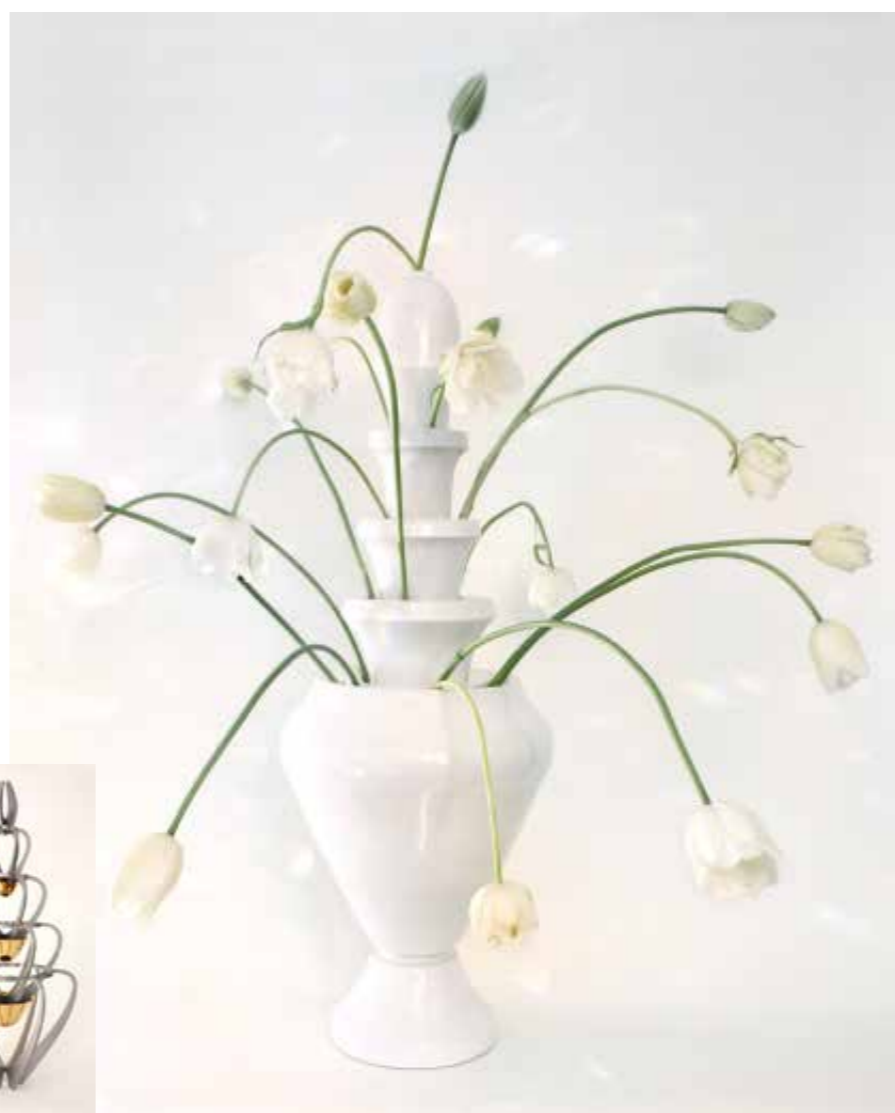
Īpaša tulpju vāze, kur katram ziedam paredzēta sava vieta.