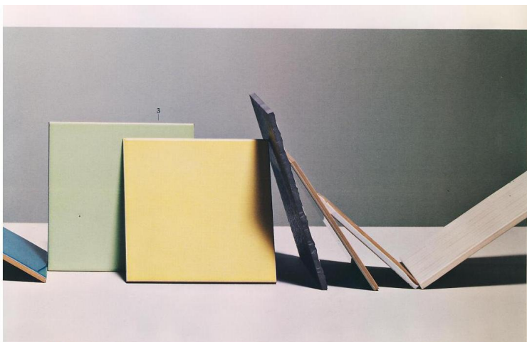
3. Ceramica Bardelli Serie Colore & Colore. Bicottura lucida, 36 colori, 6 formati. Da parete e pavimento. 20x20 cm. 4. Ex.t Linea Rivestimenti. Mosaico di vetro con tessere da 1x1 cm a rilievo bombate, 3 colori, da parete, per in-