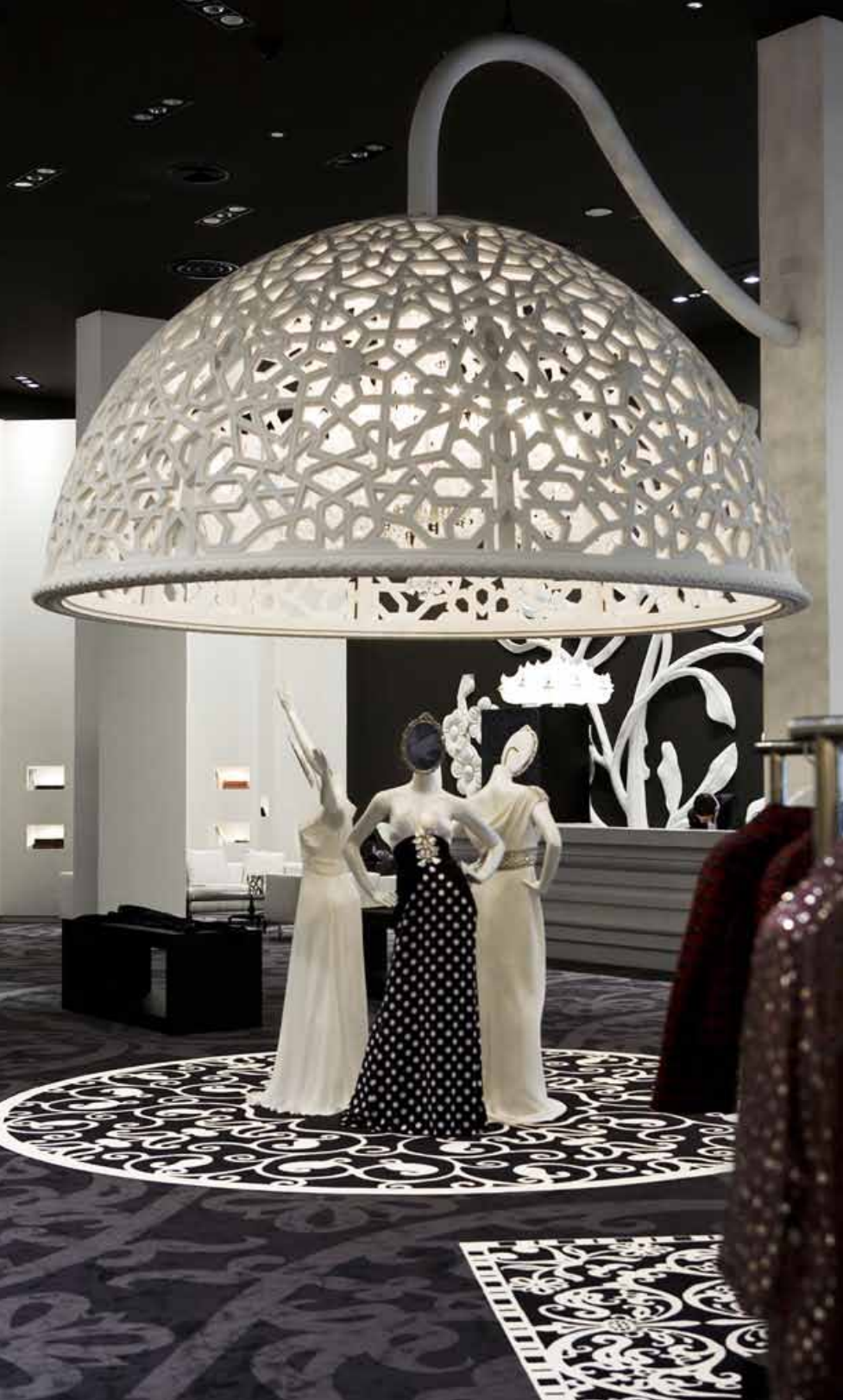
A sinistra: Villa Moda fashion store. (FOTO: yatzer.com ). A destra: rivestimenti per il bagno. Casa Son Vida, Palma di Maiorca. (FOTO: yatzer.com ).