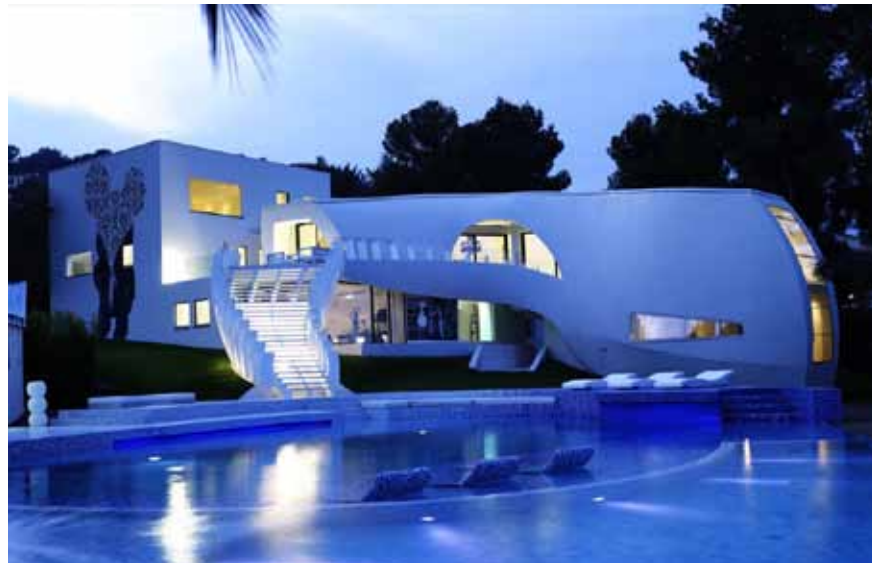
Sopra: un'immagine della piscina e della scalita esterna di Casa Son Vida, a Palma di Maiorca.

Nome: Marcel Cognome: Wanders Data di nascita: 2 giugno 1963 Titolo di Studio: Laureato cum laude alla School of Arts di Arnhem nel 1988 Segni Particolari: Naso rosso e di forma circolare. Ma questo non è il particolare peggiore: ama andare in giro (e farsi fotografare) con discutibili calosce da acqua verdi ed arancioni e con collane di perle finte saccheggiate forse a Lisa Simpson. Oggetti sul comodino: Niente. Perché? Facile: non ha comodini, li odia. Cosa ama in una donna: Che sia il meno vestita possibile (ipse dixit). Animali preferiti: Il suo MacBook. Pare gli dia sempre retta. Motto Creare con passione un ambiente di amore per la vita e fare sì che i sogni più incredibili diventino realtà. Il momento in cui impazzirà definitivamente. Cosa teme "Michelangelo, Gesù Cristo, Dio: lui sì che è il grande architetto, l'Evoluzione: ha combinato un po' di guai, ma tutto sommato continua la sua strada".